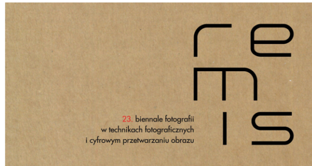
Zaproszenie na wernisaż.