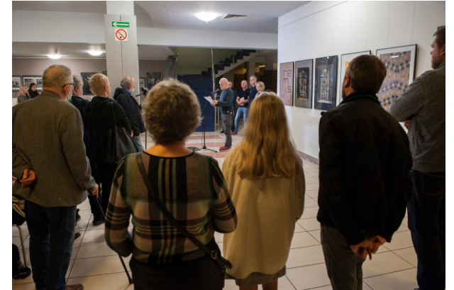
Wernisaż 23. Biennale Fotografii.