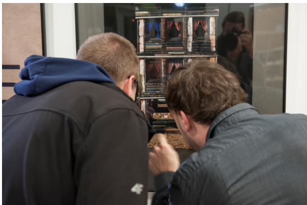
Wernisaż 23. Biennale Fotografii.