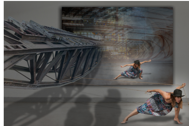
Praca Andrzeja Hajdasza na wystawie pokonkursowej 23. Biennale Fotografii