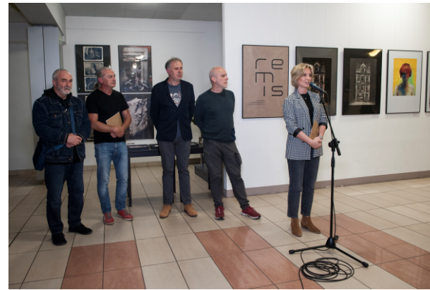
Jury 23. Biennale Fotografii.