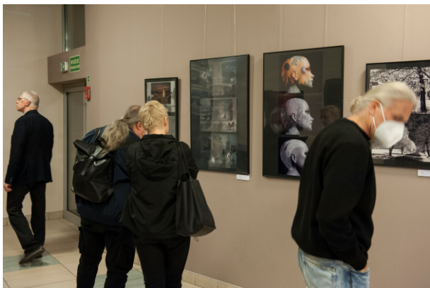
Wernisaż 23. Biennale Fotografii.