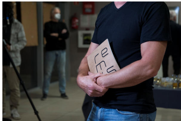
Wernisaż 23. Biennale Fotografii.