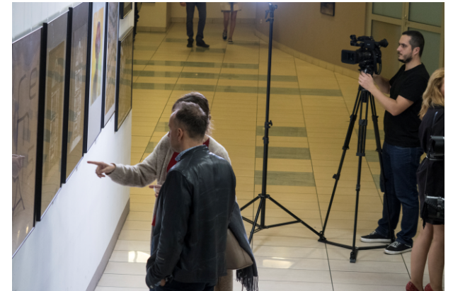
Wernisaż 23. Biennale Fotografii.